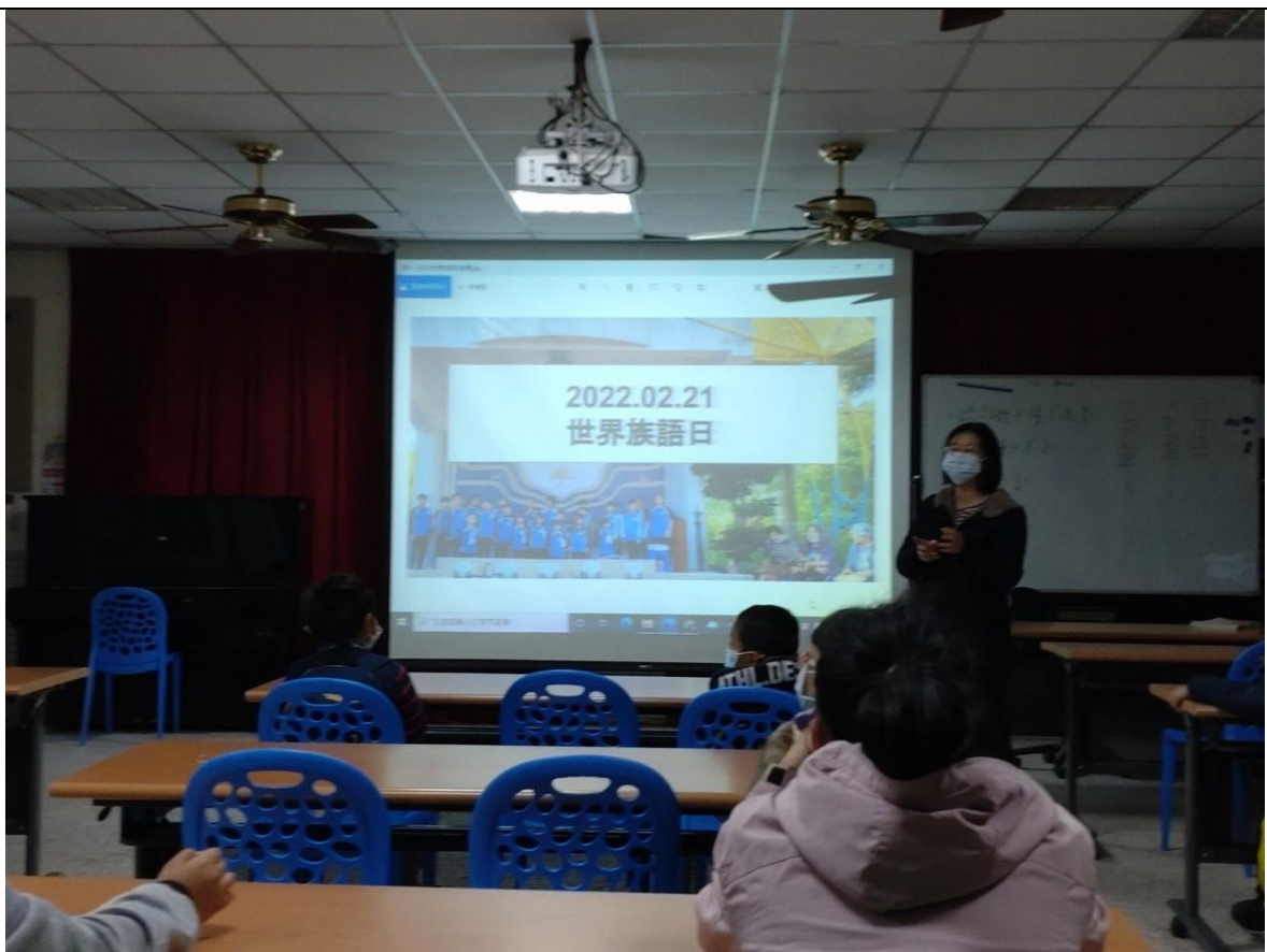
相片 9 說明：世界族語日介紹