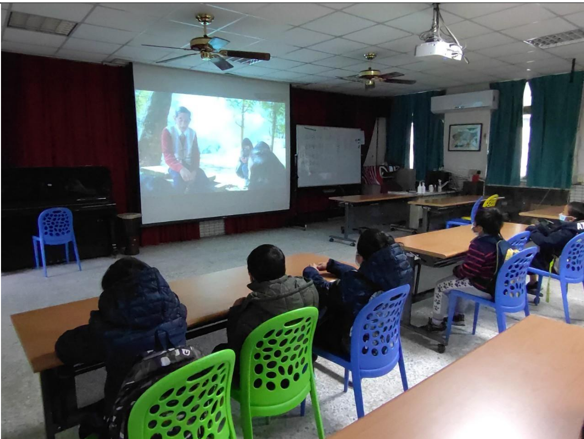
相片 10 說明：觀看世界族語日宣導影片