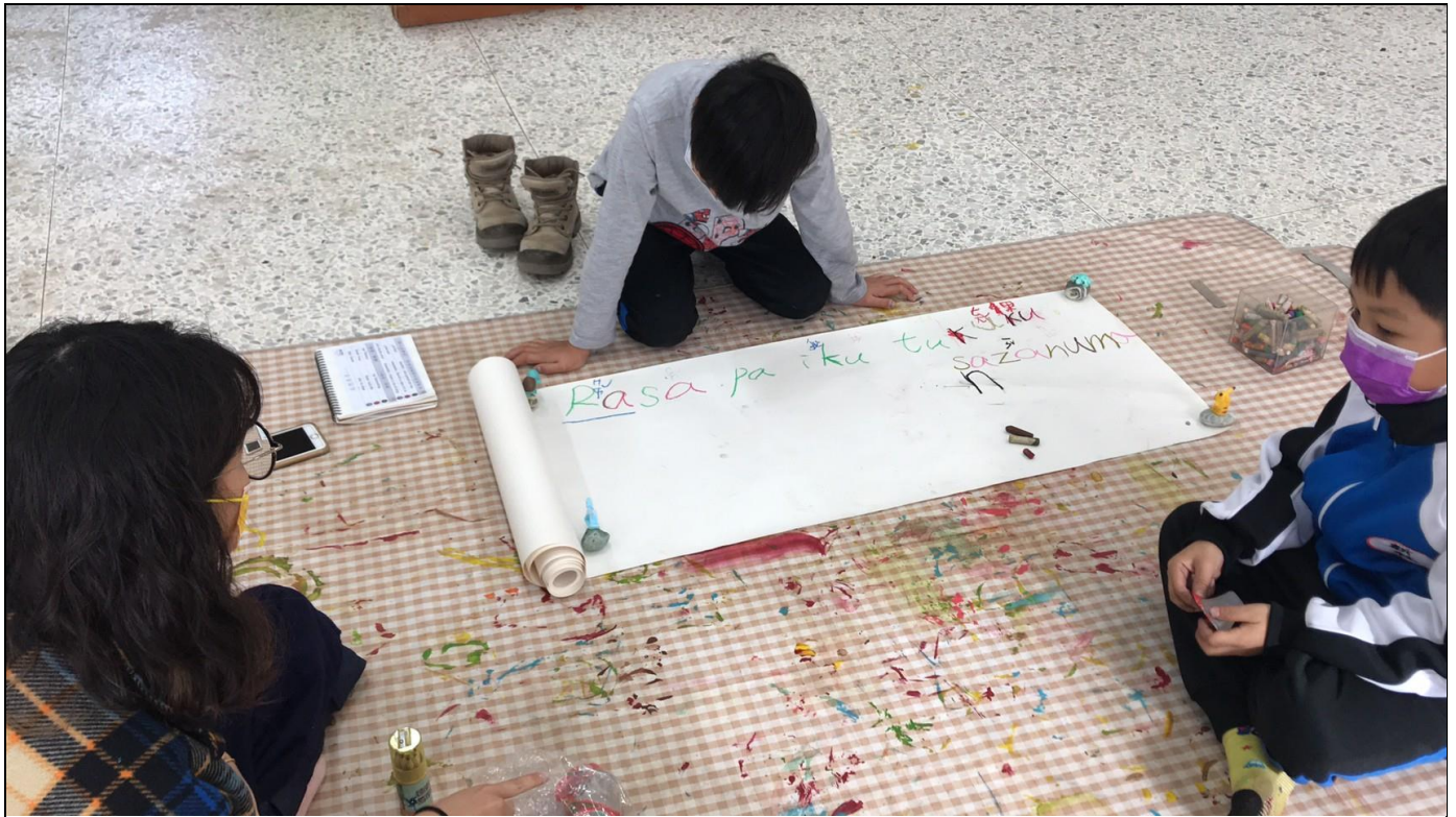
相片 5 說明：透過文字、繪畫帶學生複習拼讀單字。