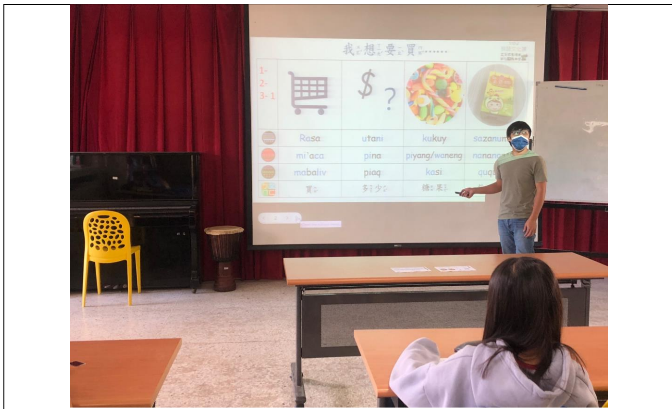
相片 1 說明：學習阿美語/海岸阿美語、布農語/丹群布農語、噶瑪蘭語的族語： 問候語、購買東西的日常用語及 1-100 的數字。