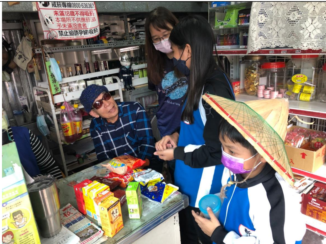
相片 8 說明：在部落的雜貨店中實際用課程中學習的問候語、購買商品句子向部落爺爺買餅乾、糖果。