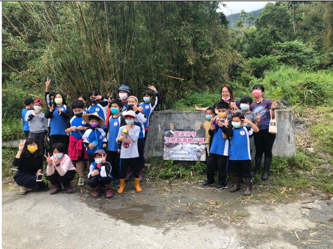
相片 7 說明：新社部落走訪踏查。