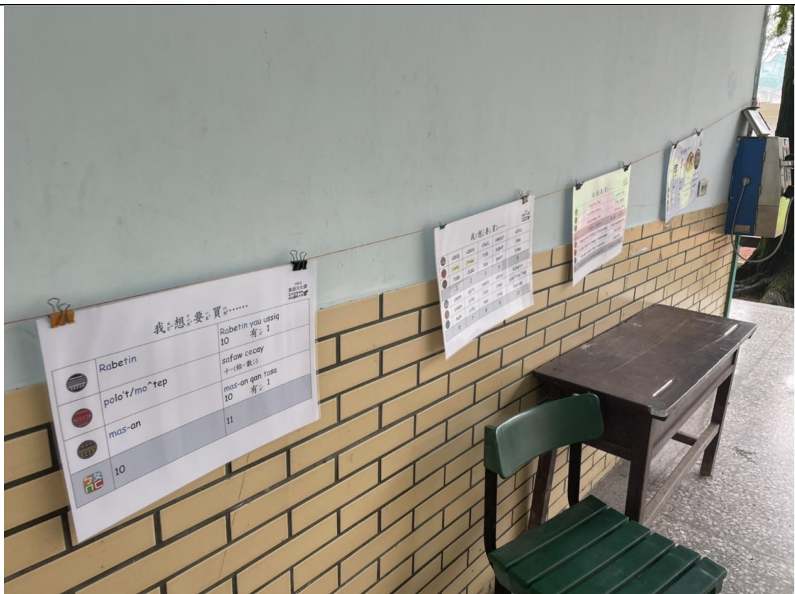
相片 4 說明：透過環境空間擺放單字圖卡的设计、讓學生能在平時課餘時間自主複習族語。