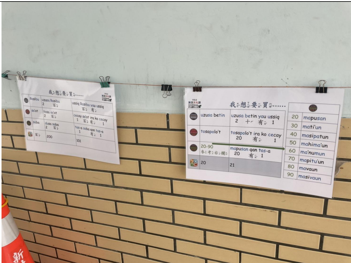
相片 3 說明：透過環境空間擺放單字圖卡的设计、讓學生能在平時課餘時間自主複習族語。